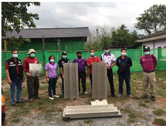
กิจกรรมมอบกระเบื้องให้กับผู้ประสบภัย(วาตภัย)