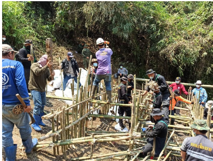
กิจกรรมบำเพ็ญสาธารณะประโยชน์(จิตอาสา) สร้างฝายมีชีวิต ๑๐ หมู่บ้าน